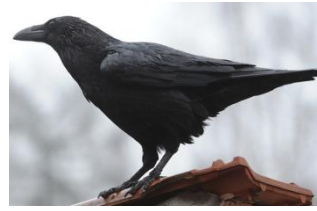
der Rabe: Krah!