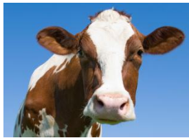
die Kuh: Muh!