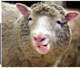
das Schaf: Mäh!