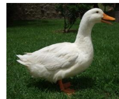
die Gans: Schnatter!