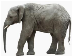
der Elefant: Töröö!