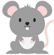
die Maus: Piep!