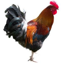
der Hahn: Kikeriki!