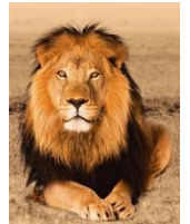
der Löwe: Roaar!