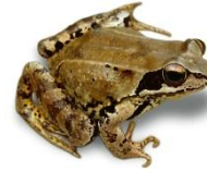
der Frosch: Quak!