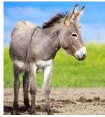
der Esel: Iah!