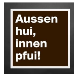
Hui! („Nicht schlecht!“)