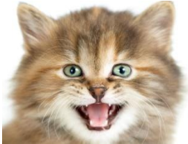
die Katze: Miau!